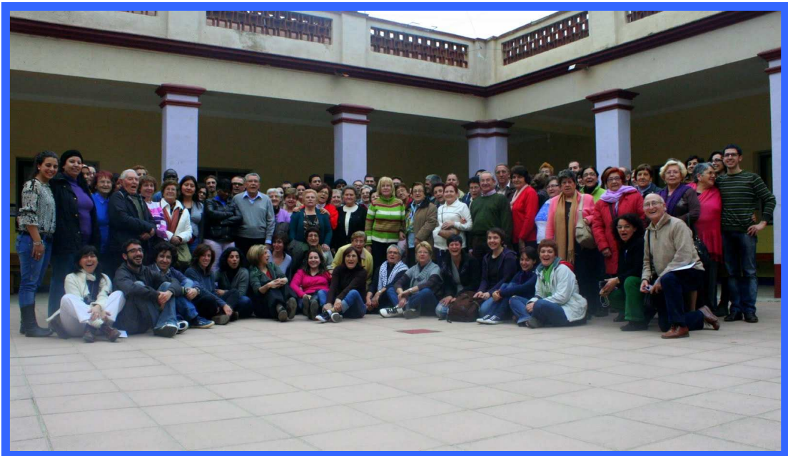
Foto de grup de les persones participants en les Jornades de reflexió d'Àgora